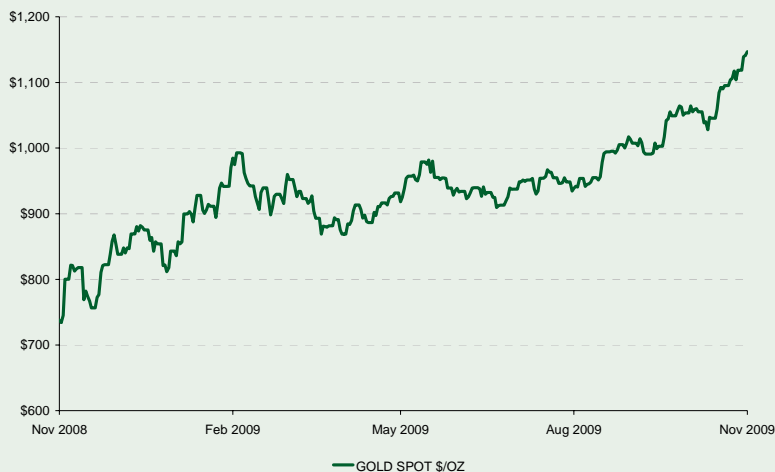
Diagramm 2: Der Preis des Goldes - ein Hinweis auf Inflation?

Einige unserer langfristigen Anlageschwerpunkte, wie etwa unser Engagement in Schwellenmärkten erscheinen nach wie vor attraktiv, obwohl sie, ähnlich wie Gold und Öl als „Crowded Trades“ (also ein Herdenverhalten unter Anlegern) zu bezeichnen sind und wir sie dementsprechend genauestens beobachten.